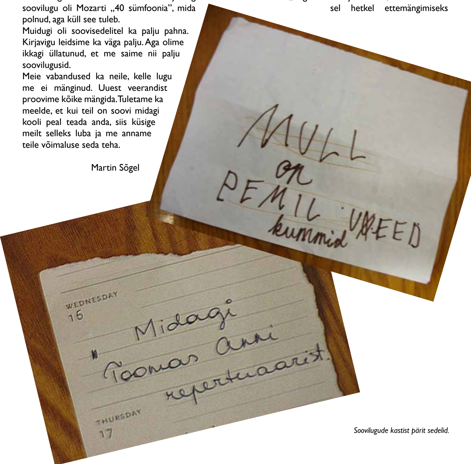
Soovilugude kastist pärit sedelid.