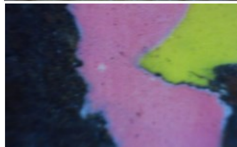
Birgit tegi pilti pinnast, kus on palju baktereid (35x suurendus).