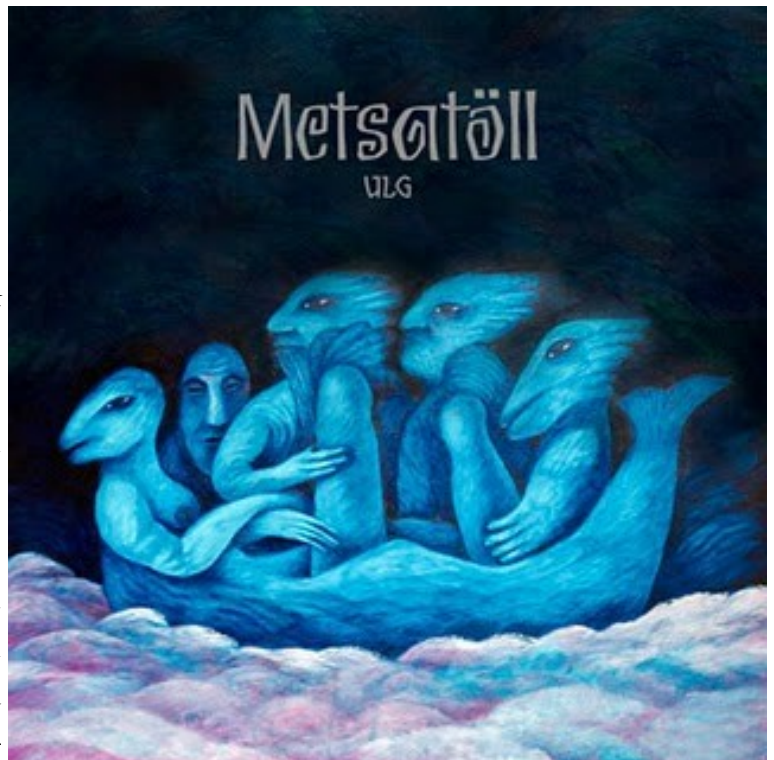
Metsatölli albumikaas.

Metsatöll sai 24. veebruaril 15 aastat vanaks. Bänd on välja andnud üsna mitu plaati. Minu arust on see üldse Eesti parim ansambel. Kuulan just sellist muusikat ja see popmuusika tilu-lilu mulle peale ei lähe. Mis mulle väga meeldib—tegemist on ansambliga, kus pole peaaegu üldse liikmed vahetunud.