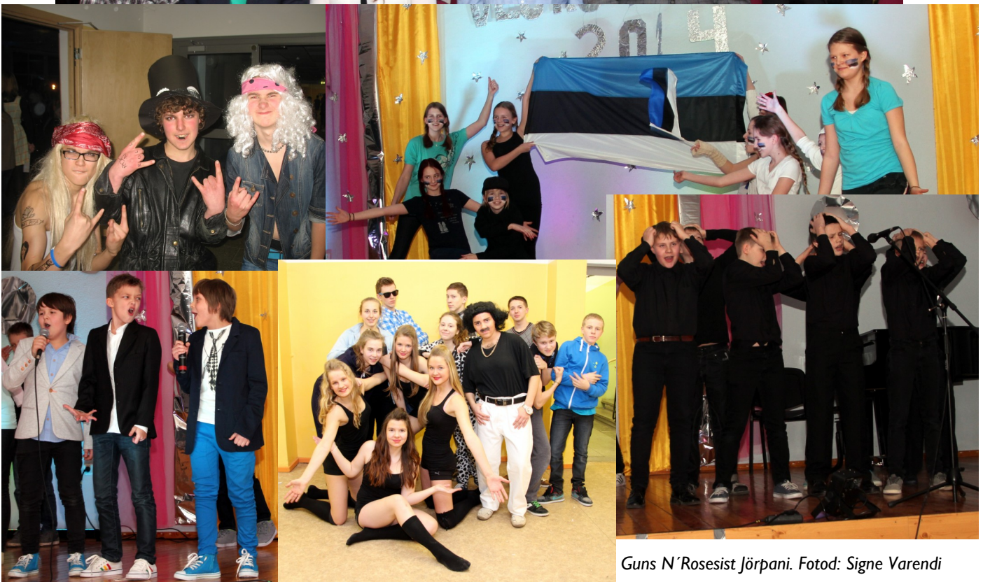
Guns N'Rosesist Jõrpani.